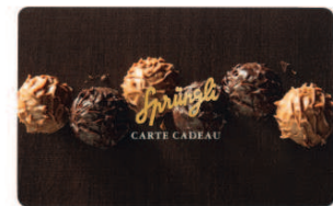
Sprüngli Carte Cadeux