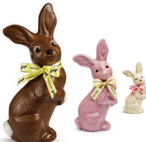
Lapin Nico en chocolat au lait, quatre tailles et cinq saveurs