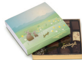
Boîte «Matin de Pâques»