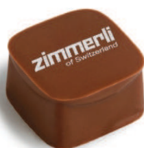
Pralinés avec impression