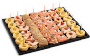
Assiettes Apéro arrangées

Nos croissants ou notre brioche aux truffes sont les viennoiseries parfaites pour vos réunions matinales. Pour le déjeuner d'affaires, nous agrémentons notre pain de savoureuses tartinades, de divers ingrédients et de légumes frais pour créer de délicieux sandwiches. Nous adaptons notre assortiment à la saison, qu'il s'agisse des salades, des sandwiches ou du birchermuesli. Offrez à vos collaborateurs, clients ou partenaires commerciaux une grande diversité de produits frais.