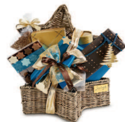
Corbeilles de Noël