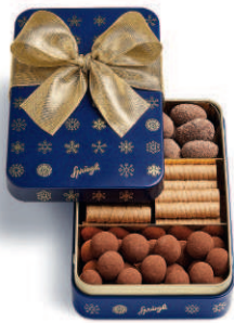
Boîte métallique «Variété»

Profitez de Noël pour offrir des moments de fêtes savoureux sous la forme d'un chocolat d'exception, de Biberli fondants ou de créations dans une jolie boîte en bois. Des gourmandises et arômes délicats qui raviveront des souvenirs – telle est la saveur authentique de Noël. A partir d'ingrédients sélectionnés et réalisés avec finesse artisanale, nous avons créé de véritables délices et avons laissé notre savoir-faire traditionnel en matière de chocolat s'exprimer dans la production de créations festives. Nous nous ferons un plaisir de vous aider à créer des moments de plaisir inoubliables pour Noël pour vos collaborateurs, clients et partenaires commerciaux.