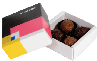
Boîte cadeau personnalisé

Pour les anniversaires, faites sensation avec des gâteaux exceptionnels et des cadeaux en chocolat haut de gamme. Félicitez vos collaborateurs, clients ou partenaires commerciaux à l'occasion d'une journée spéciale avec une surprise bien particulière. Avec un cadeau de la Confiserie Sprüngli, la célébration d'une nouvelle année de vie se fait dans le plus grand plaisir. Nous avons également le cadeau de naissance approprié. Gâtez les jeunes parents avec une création de la maison Sprüngli.