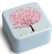
Boîte métallique «Arbre de Pâques» bleue

Laissez-vous inspirer par notre univers de Pâques coloré et trouvez un cadeau d'entreprise approprié, qu'il s'agisse de notre célèbre lapin Nico dans l'une des cinq déclinaisons de saveurs ou de la petite boîte métallique raffinée arbre de Pâques. Nous sommes convaincus que nous pourrions trouver ensemble le cadeau adapté à vos besoins. Découvrez nos cadeaux d'entreprise les plus récents, comme la bonbonnière en forme de lapin, les coffrets cadeaux printaniers, les nids de Pâques et bien d'autres délices colorés réalisés avec le meilleur chocolat suisse. L'équipe «clients professionnels» se fera un plaisir de vous conseiller.