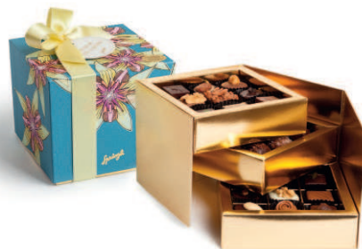
Cube disponibles dans différentes matières