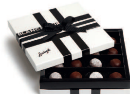
Truffles Blanc et Noir, affinées avec le meilleur champagne Perrier Jouët