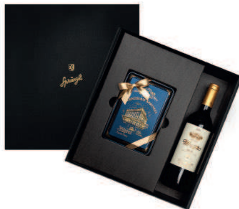
Coffrets cadeaux en diverses variantes