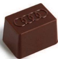
Pralinés avec relief

L'assortiment raffiné de chocolats s'étend des chocolats classiques aux innovations. Sélectionnez des créations de pralinés et de truffes au chocolat noir, au lait ou blanc et réalisez votre composition personnalisée. Nous utilisons uniquement le cacao issu des meilleurs zones de production au monde, que nous combinons ensuite à de la véritable vanille ou du champagne raffiné pour générer des moments chocolat uniques. Nos créations chocolatées sont préparées chaque jour à partir des meilleurs ingrédients. Nous fabriquons nos produits sans conservateurs, avec une durée de conservation de 36 jours ou, sur demande, de 90 jours. Créez vos propres pralinés avec une impression personnalisée, le cachet raffiné du logo de votre entreprise, imprimé ou en relief, ainsi qu'un délicieux fourrage de votre choix.