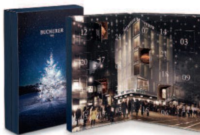
Calendrier de l'avent personnalisé