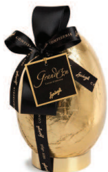
Oeuf en or Grand Cru Sélection de truffes