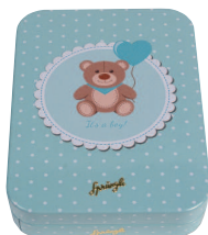
Boîte métallique petit garçon ou petite fille