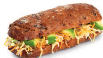
Créations saisonnières de sandwiches